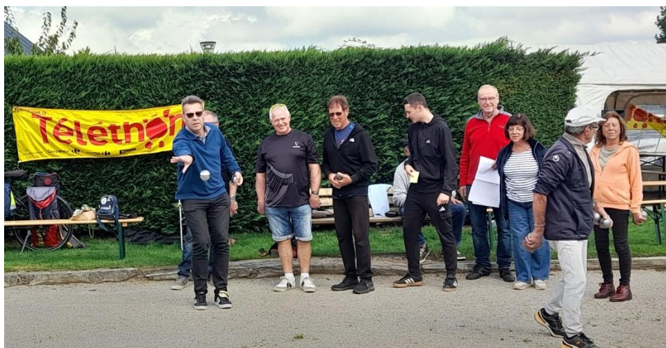
Tournoi de Pétanque du Samedi 27 Septembre