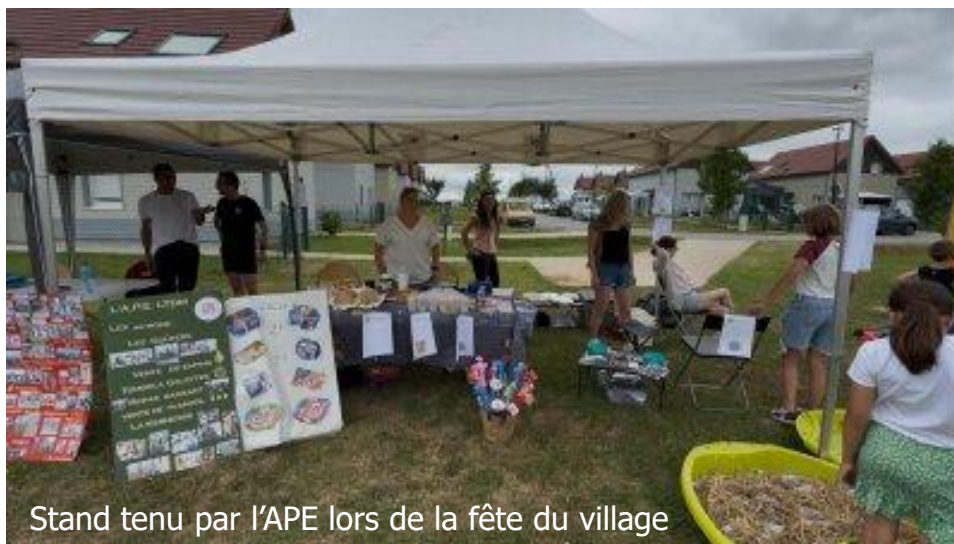
Stand tenu par l'APE lors de la fête du village